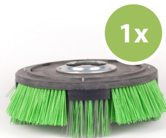
2. Terrazza Geo TECH Droog of nat borstelen van geotextiel (gronddoek en anti-worteldoek).