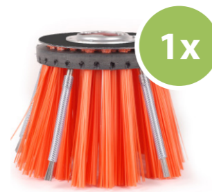
3. Weedee® onkruid borstel Haalt onkruid en mossen van het oppervlak en van tussen de voegen.