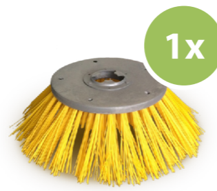
4. Terrazza Sweeper Veegborstel, ideaal voor borstelen van losliggend vuil.