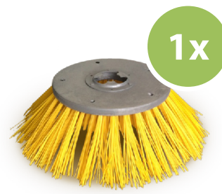
4. Terrazza Sweeper Veegborstel, ideaal voor borstelen van losliggend vuil.