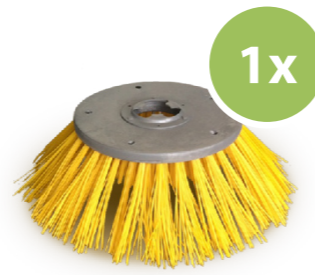
4. Terrazza Sweeper Veegborstel, ideaal voor borstelen van losliggend vuil.

KEES VAN DER SPEK TUINMACHINES ★ STOLWIJK