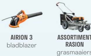
AIRION 3 bladblazer