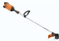
EXCELION ALPHA bosmaaier