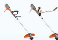
EXCELION 2 bosmaaier