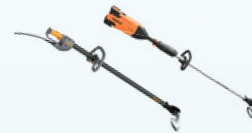
CULTIVION & CULTIVION ALPHA cultivators