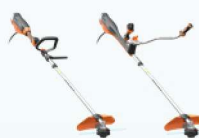
EXCELION 2 bosmaaier