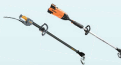
CULTIVION & CULTIVION ALPHA cultivators