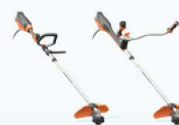
EXCELION 2 bosmaaier