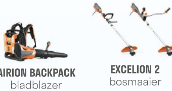
AIRION BACKPACK bladblazer