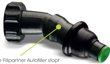
De Fillpartner Autofiller stopt automatisch met vullen.